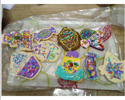
1차 가족사랑의 날

코로나19의 영향으로 2020년도 가족사랑의 날은 각 가정에서 비대면 가족여가활동으로 진행하였습니다. 초등학교 자녀를 양육하는 15가정을 대상으로 달콤한 쿠키 데코하기, 숲속의 다육 거북이 만들기, 가족보드게임 등을 4회기 진행하여 가족이 함께 즐거운 여가시간을 보내는 시간이 되었습니다.